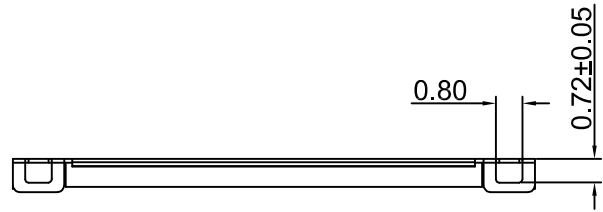
字模示意图 (打正面)